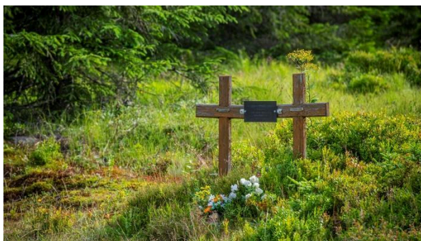
Obrázek 2 – Památník akce Jizerka

července je přepadly s obrovskou přesilou. Skauti byli donuceni si lehnout na zem a jednotky po nich začaly střílet. Masakr skončil až ve chvíli, když jeden velitel dal pokyn, „klid, soudruzi, neprasečte, potřebujem taky nějaké živé.“ Tyto podrobnosti máme zachované