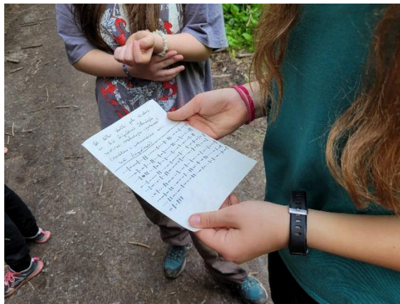
Obrázek 4 – Podoba dopisu při hře

hranice. Po nějaké době chůze nastane noc, hráči si musí posedat a dát šátek přes oči. V tu chvíli k nim přiběhnou příslušníci bezpečnosti a začnou po nich křičet a můžou použít audio nahrávky pistole. Hráči si stále nesmí sundat šátky. Pak se všichni musí postavit a jsou poslepu hnáni ke klubovně/místnosti. Cestou část hráčů příslušníci bezpečnosti oddělí, ti si můžou sundat šátky, protože pro ně hra končí. Zbytek příslušníci bezpečnosti zavrou do místnosti, tam si můžou sundat šátky. Na