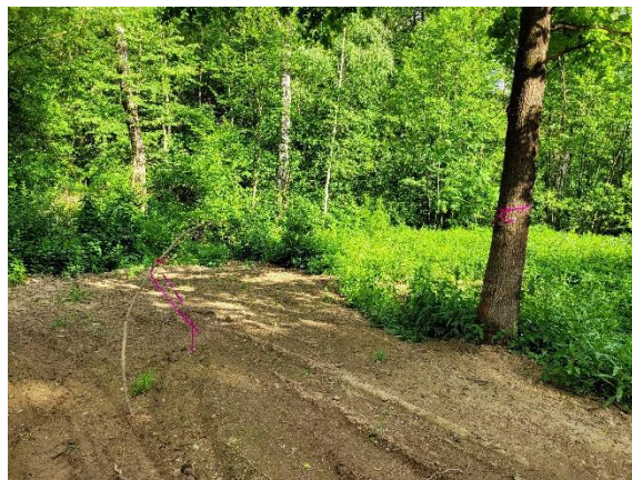
Obrázek 3 – Označení hranic v terénu (růžové řáborky)

nich střílet. Všechny je zatknou a několik z nich „zemře“. V rámci Borůvkové brigády se bude víc běhat, zatímco akce Jizerka bude víc zaměřena na zážitek a emocionální prožitek situace.