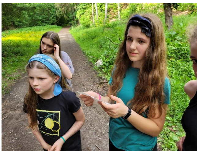
Obrázek 6 – luštění dopisu od StB

pistole. Všechny hráčky se hrozně lekly. Poté už jsme je s příslušníky bezpečnosti v hadovi odváděli pryč. Se zavázanýma očima jsme došli až ke klubovně. Šlo to hezky, hráčky se tomu trochu smály, což bylo matoucí, ale říkaly, že to byl stres. Já jsem musela ještě sesbírat věci, takže jsem neměla pod kontrolou průvod, a proto mi na konci „přežily“ jen tři holky, které byly odvedené do „vězení“ – klubovny. Přinesla jsem jim tam dopis, že hra končí. Ostatní už čekaly venku.