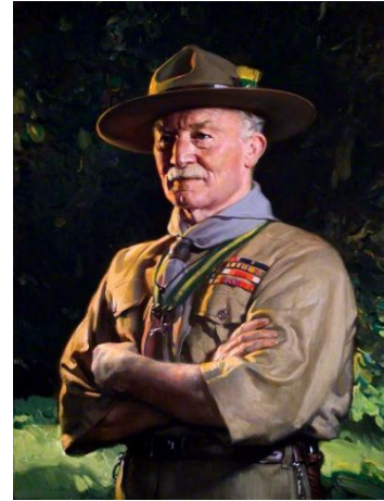
Obrázek 1 – Robert Baden-Powell

Skaut je mezinárodní apolitická organizace, založil ji britský důstojník Robert Baden-Powell (dále B.P.). Nejdříve to měla být vojenská organizace zvědů a průzkumníků, ale když o tom napsal B.P. knihu, velmi si ji oblíbili britští kluci a začali zakládat družiny a učit se dovednostem z knihy. Na základě toho B.P. uspořádal první skautský tábor na ostrově Brownsea a napsal svou druhou knihu, tentokrát určenou přímo pro malé kluky – Scouting for Boys . 1