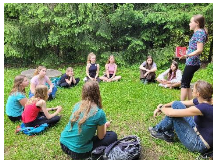
Obrázek 5 - Úvodní motivace a uvedení do děje

Pak jsme se přesunuly do hracího pole, kde jsem je rozdělila do skupinek podle toho, co budou hrát. Moje kamarádka byla do procesu zatažena už předem, takže mi pomáhala