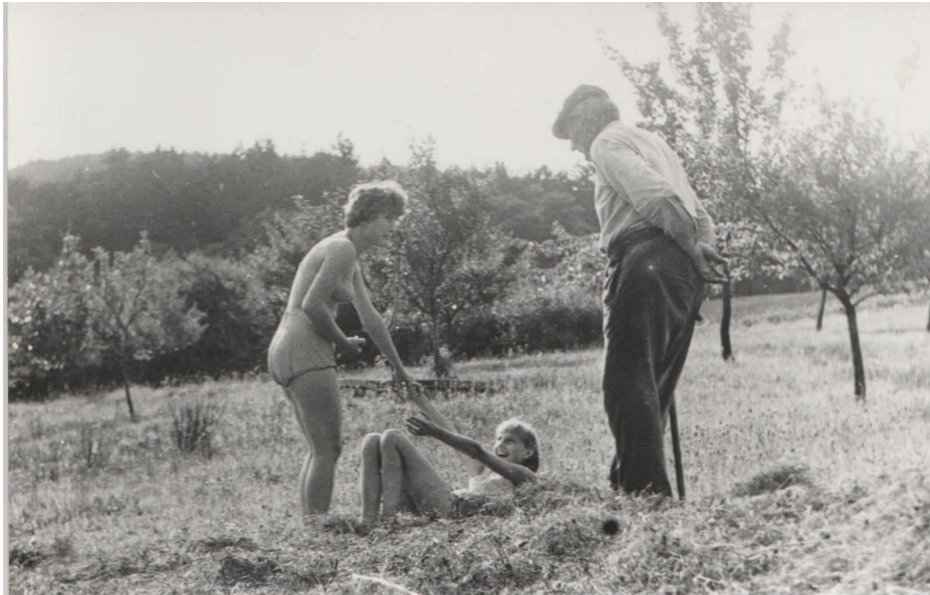
Obrázek 6 V Knižkovicích