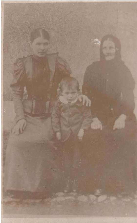
Obrázek 10 Nejstarší foto