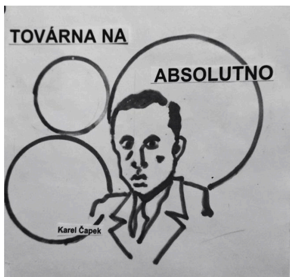
OBR. 1. PRVNÍ VERZE PLAKÁTU

Naše premiéra inscenace se uskutečnila ve středu 21. února od 18:00 hodin v rámci umělecké přehlídky Od svědectví k podobenství, kterou pořádá Památník Ticha.