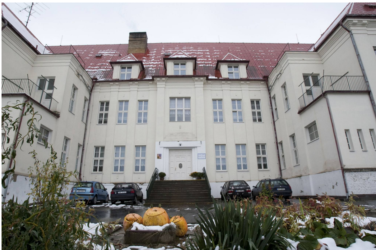
Obrázek 2: Budova Dětského domova Pyšely ( https://1gr.cz/fotky/lidovky/09/123/org/KIM2ffbd1_9p3h0478_2_.jpg )

Domov má jednu velkou budovu, jejíž součástí je i školní jídelna. Okolo se rozprostírá velká zahrada s fotbalovým hřištěm. Součástí instituce je také externí dům se zahradou, také v Pyšelech, na kterém mají skupiny větší soukromí a prostor.