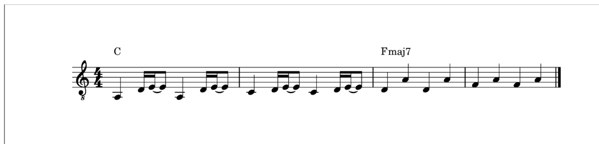
Obrázek 1 - notový zápis kytarového riffu v písni Jít dál

Píseň začíná v tónině C dur. Hlavní melodickou linku v předešle a ve slokách tvoří elektrická kytara, která hraje jednoduchý riff v durové pentatonice (viz. Obrázek 1). Basová linka je velice jednoduchá. Ve slokách se zde hrají v naprosté většině celé noty na první dobu. V písni se dvakrát objeví krátké basové sólo. První je na čtyři takty druhé na osm taktů. Na bicí nástroje je hráno pomocí metliček, které se používají zejména v jazzové muzice. Já jsem chtěl, aby byl zvuk bicích jemný a nerušil celkovou náladu písně, proto jsem se rozhodl pro metličky.