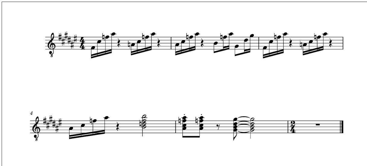
Obrázek 5 - notový zápis rytmické kytary v písni Padáky

O basové lince jsem měl také poměrně jasno už při kompozici hlavního kytarového motivu, chtěl jsem, aby byla basová linka v této písni zajímavá a zastoupila sólovou kytaru, kterou jsem chtěl schválně pouze do sóla, aby v jiných částech písně vynikla právě baskytara. Sólová kytara je tedy pouze v intru a v sólu, kde v naprosté většině hraje ve Fis dur pentatonice, ale opírá se měnící se basové tóny. Při tvorbě sóla jsem hodně poslouchal Lo-fi písně a novou vlnu jazzu, protože jsem chtěl mít své kytarové sólo postavené podobně jako v těchto žánrech.