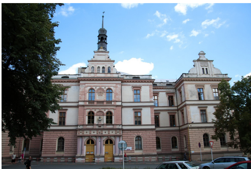
Obr. 5 - Budova bývalé Cvičné školy

Účelem cvičné školy bylo poskytnout studentům pedagogiky na Učitelském ústavu lehce dosažitelnou možnost stáže a vyzkoušet si své umění učit nové věci.