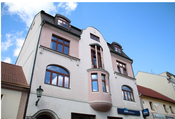
Obr. 3 - Budova pojišťovny

Budova bývalé pojišťovny je nádherná stavba z dob první republiky, nacházející se na velmi frekventovaném místě v ulici směřující z dolního náměstí na horní. Na místě pojmenovaném po husitském vojevůdci – v Žižkově ulici 26 - II (Obr. 3).