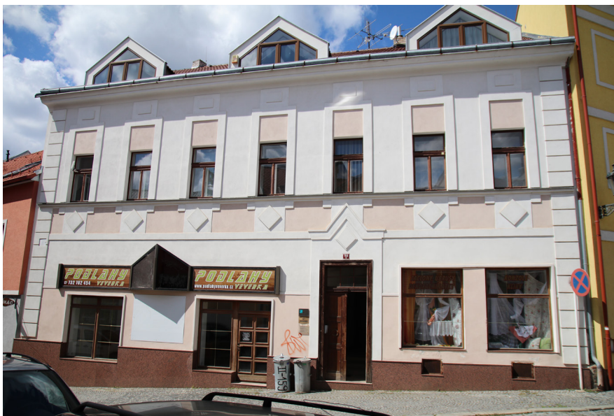
Obr. 2 - První dům Lionových na adrese Na Valešince 159/2

Zářivého domu v ulici Na Valešince 159/2 (Obr. 2) si dnes můžeme povšimnout velmi rychle. Pohodlí domova se zapřít nemohlo, otec měl dobrou práci, dům přímo u ikony Příbrami a mezi rodiči to pravděpodobně stále fungovalo vdobře, protože v roce 1935 se narodil Pavlův mladší bratr Jiří.