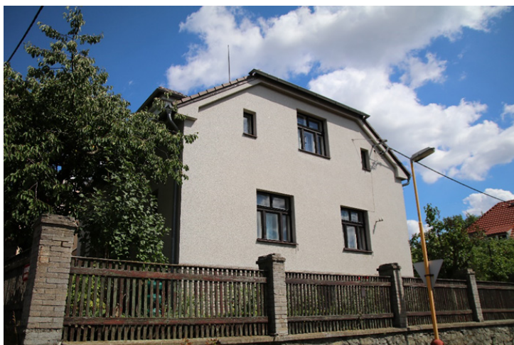
Obr. 4 - Nový dům rodiny Lionů

Práce v pojišťovně sice jistě nebyla jednoduchá, ani kdovíjak zábavná, ale Bedřichovi a jeho rodině viditelně pomohla.