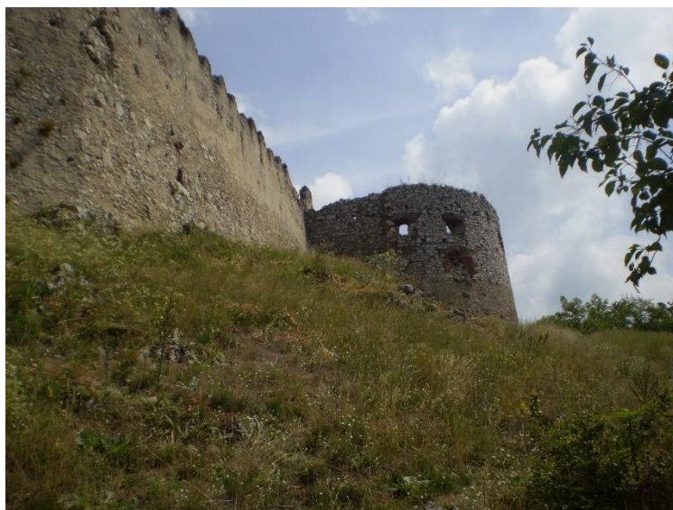
Obrázek 4 Zřícenina Plaveckého hradu