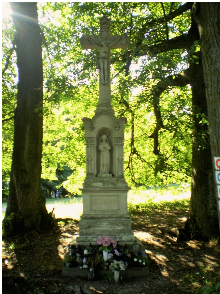
Obrázek 14 Kříž na rozcestí Biely kříž