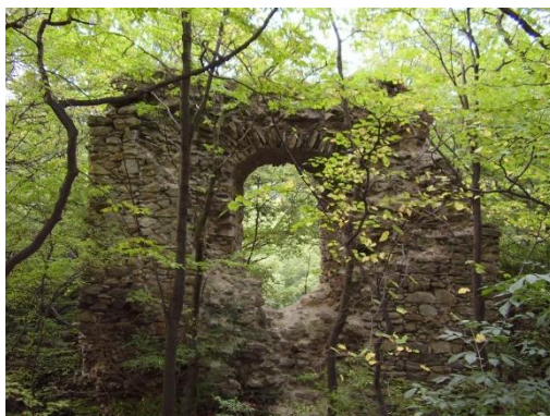
Obrázek 17 Biely kameň