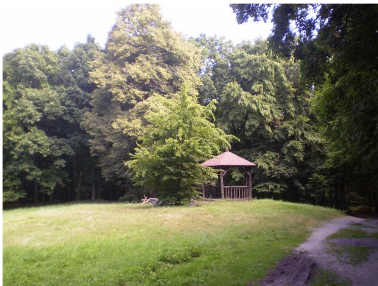
Obrázek 9 Altánek u cesty