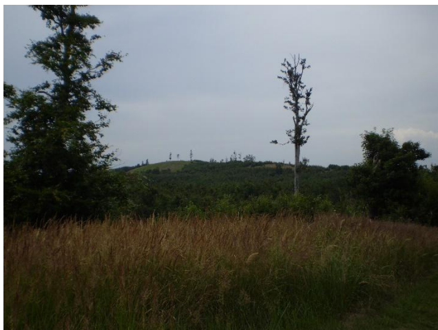
Obrázek 19 Hřeben kopce Koží Chrbát