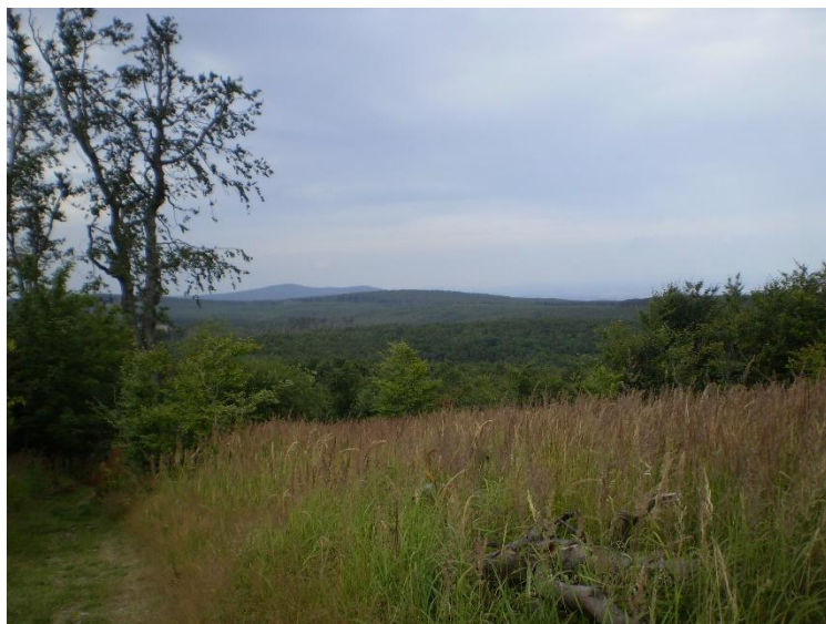
Obrázek 21 Výhled z kopce Somár