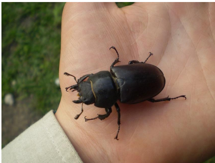
Obrázek 10 Brouk nalezený u cesty