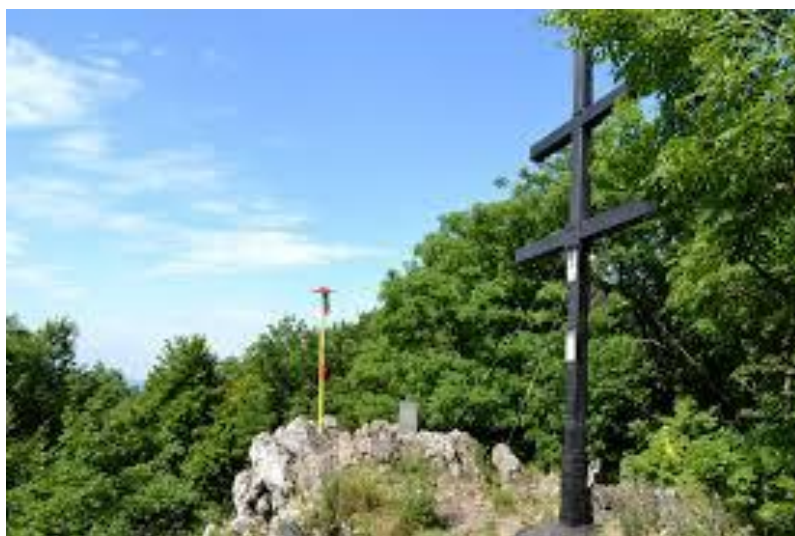
Obrázek 5 Vrchol Záruby