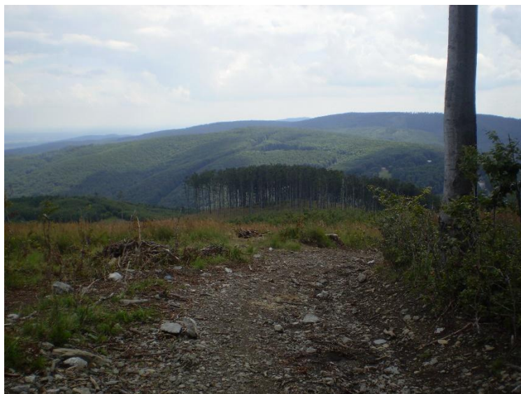
Obrázek 22 Výhled na lesy z vrchu Čmelok