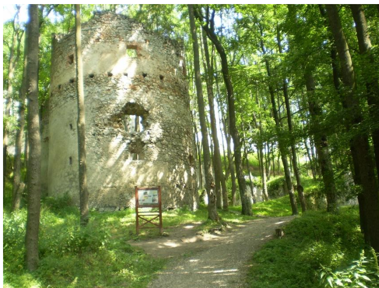
Obrázek 3 Zřícenina hradu Dobrá voda