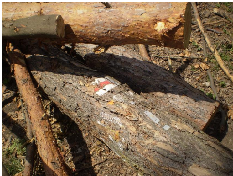
Obrázek 1 Turistické značky jsou na mnohých místech opravdu zrádné.