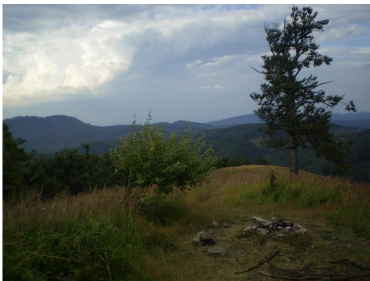
Obrázek 7 vrch Skalnatá