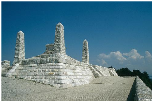
Obrázek 2 Mohyla M. R. Štefanika