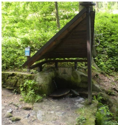
Obrázek 13 Mariin pramen