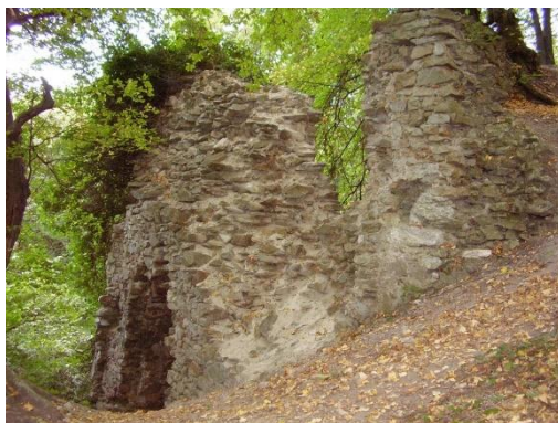
Obrázek 16 Biely kameň