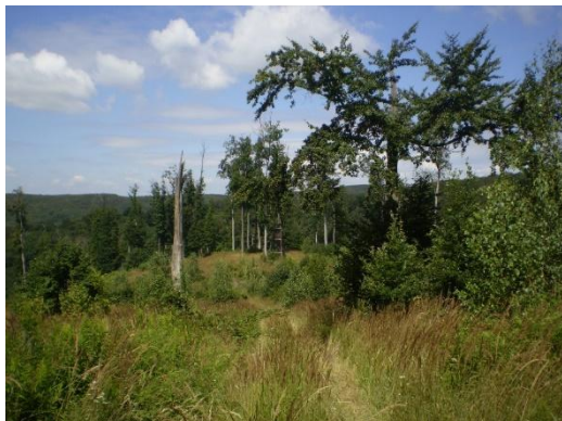
Obrázek 12 Druhé zastavení - mýtina