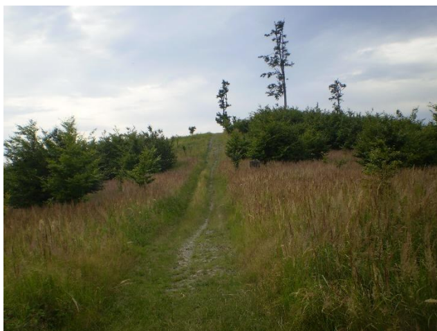
Obrázek 20 Cesta na vrchol od rozcestí Somár