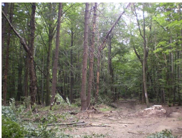
Obrázek 18 Smrky na rozcestí Kozí Chrbát