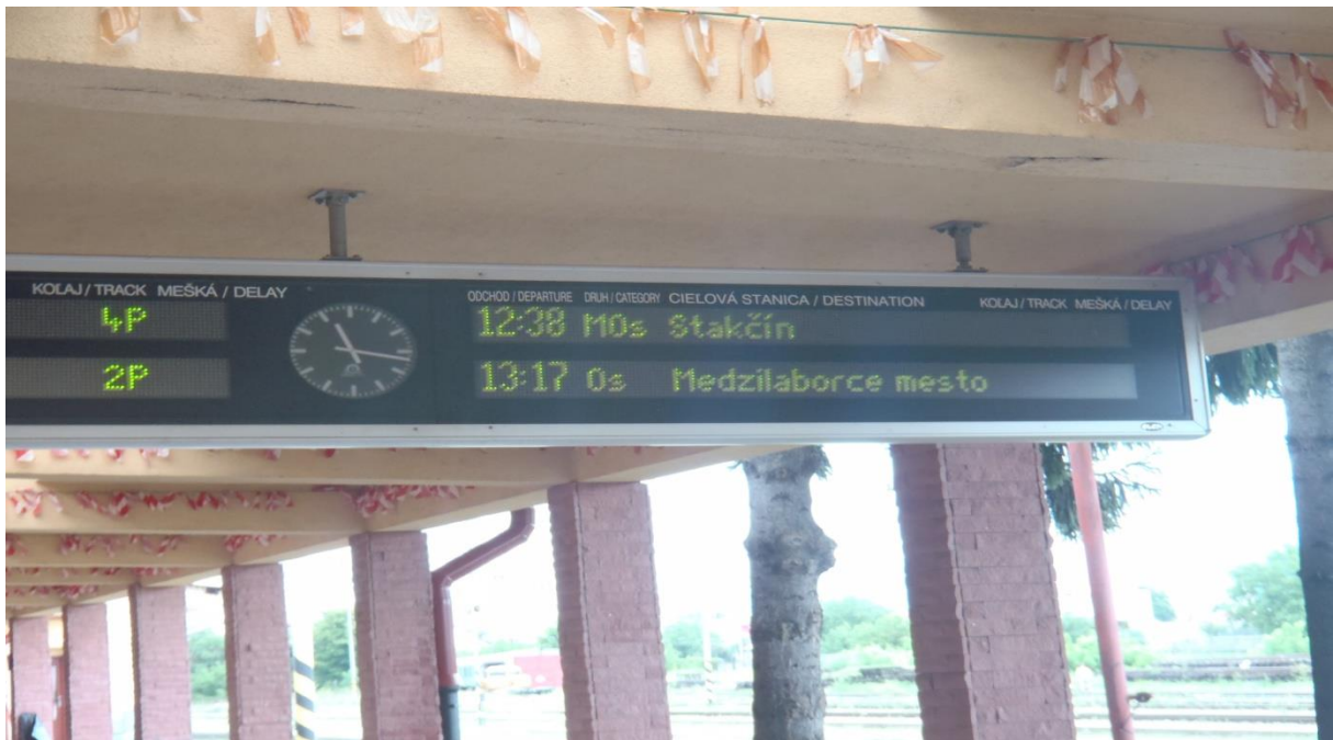
Foto 1 - Nádraží v Humenném