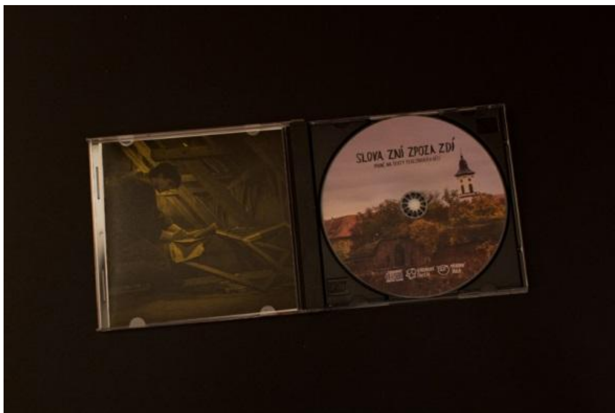
Obrázek č. 4: Booklet