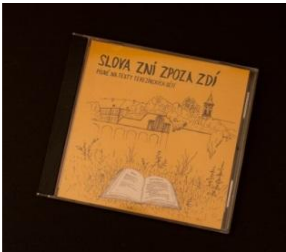
Obrázek č. 3: Vnitřek CD