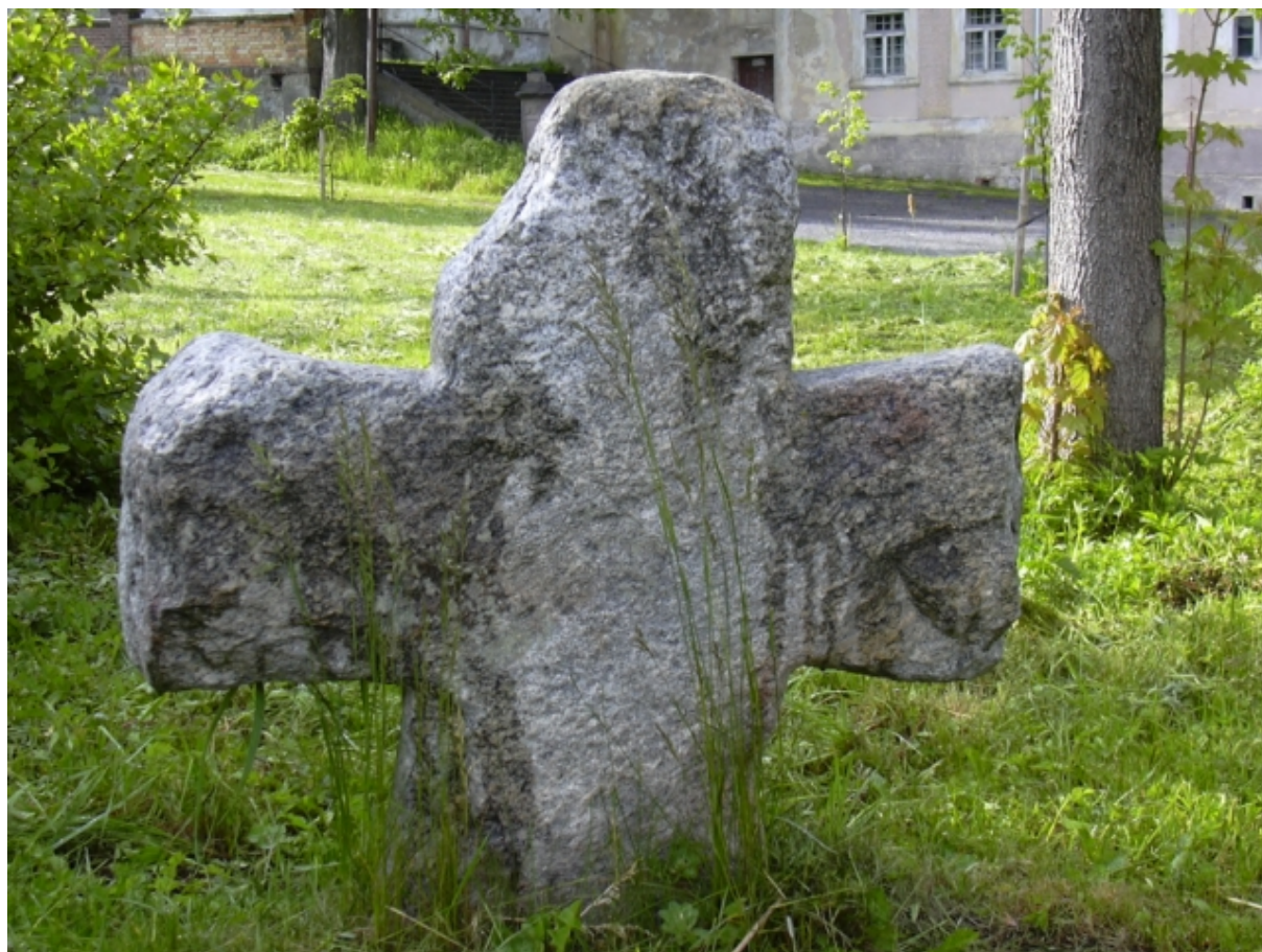
Smírčí kříž před kostelem