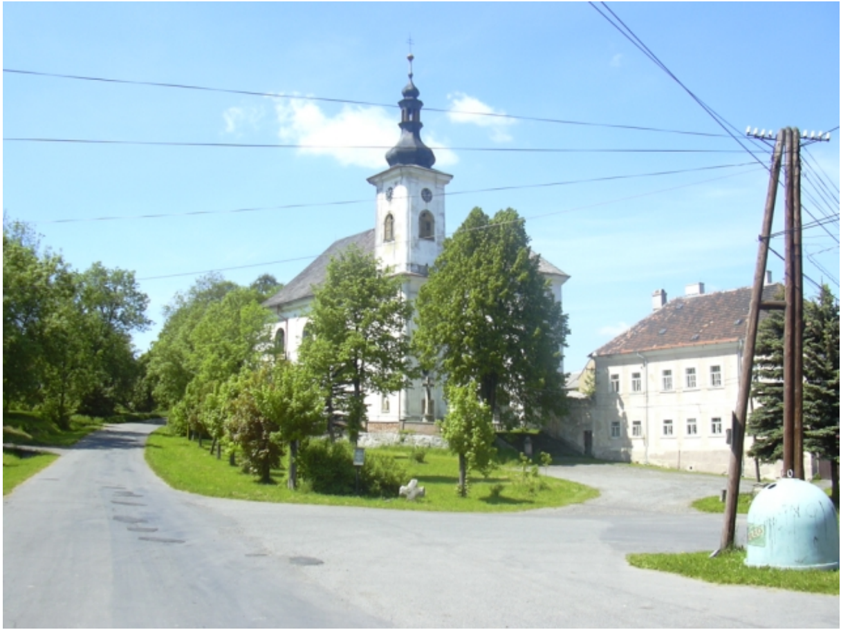
Kostel s farou