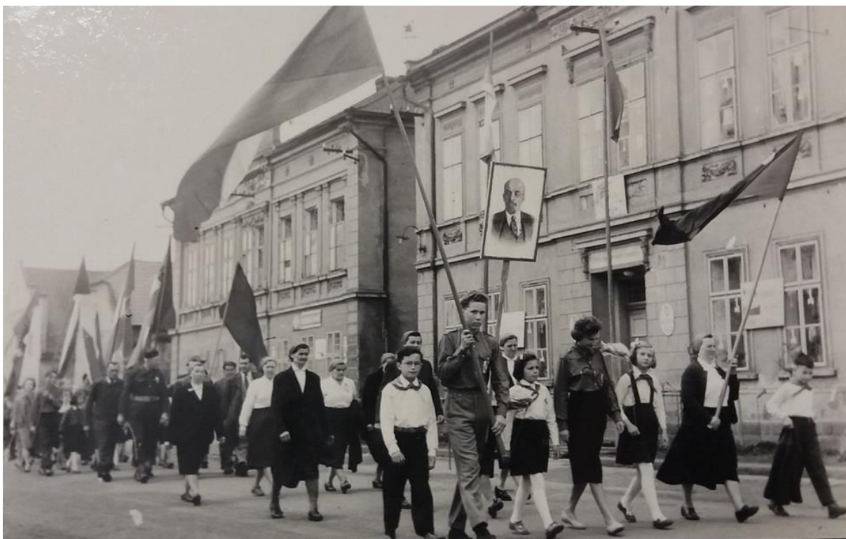
Obr. 2: Prvomájový průvod ve střediskové obci Katusice, 1958 (Zdroj: Obecní úřad Katusice, pamětní kniha).

Úpadek náboženské víry měl vliv i na změnu životního stylu a to v mnoha ohledech. Jedním z příkladů je proměna přístupu k masopustu. Dříve byl bráný jako velká oslava před dlouhým velikonočním půstem. Dnes však většina lidí jen slaví původ masek a následné postní období se vynechává. I květnová májka ztratila svůj obsah. Ještě před pár lety se konalo jak slavnostní vztyčování májky a její kácení, tak i dobrodružné hlídání májky v noci a snaha ji ukrást. Májové pobožnosti už se nekonají. Dnes lidé na otázku, proč se staví májka, už ani nedokážou odpovědět („proč se stavěla, nevím, ale byla při tom vždy zábava“).