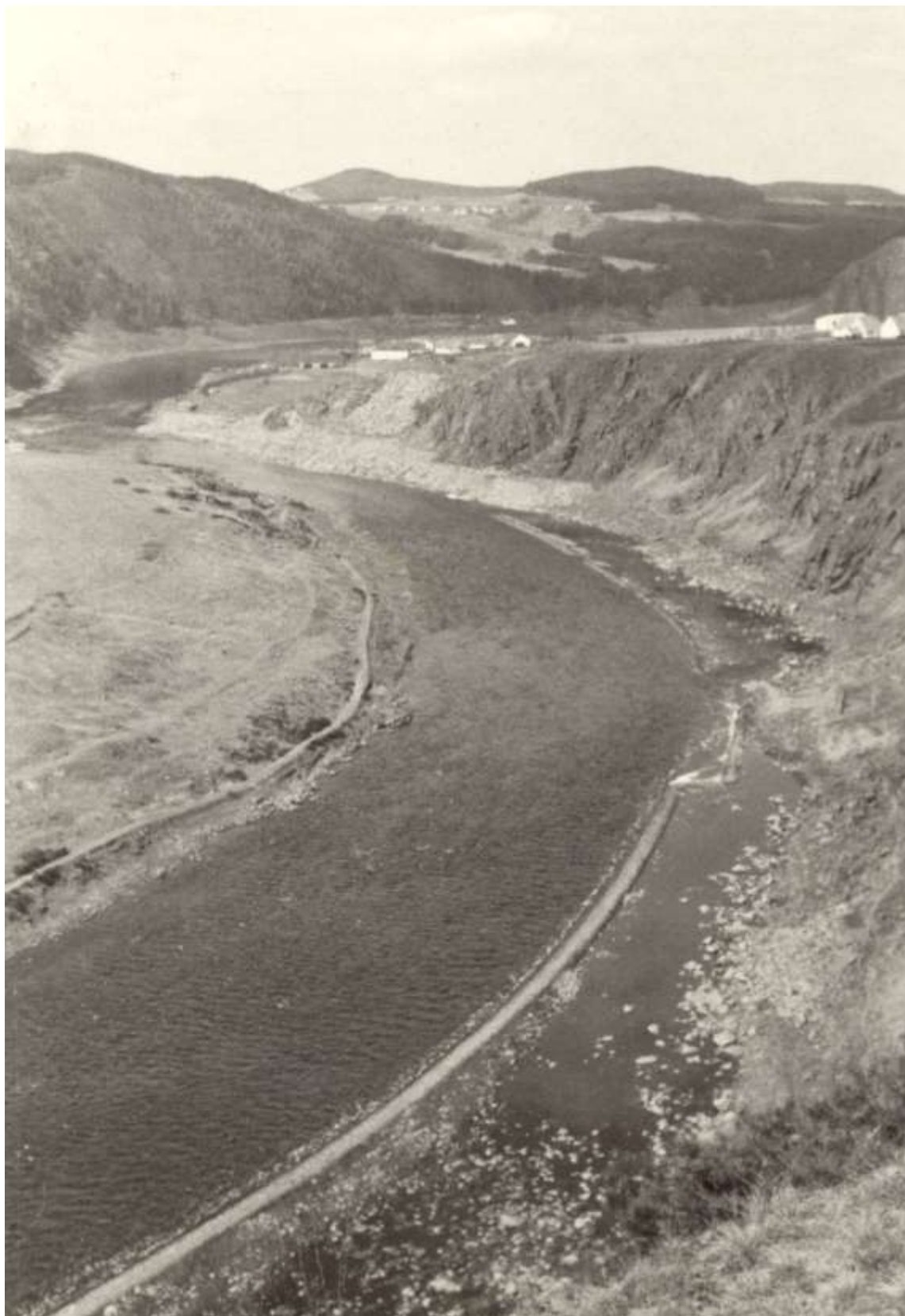
Záhyb řeky před Zvírotice, před napuštěním.