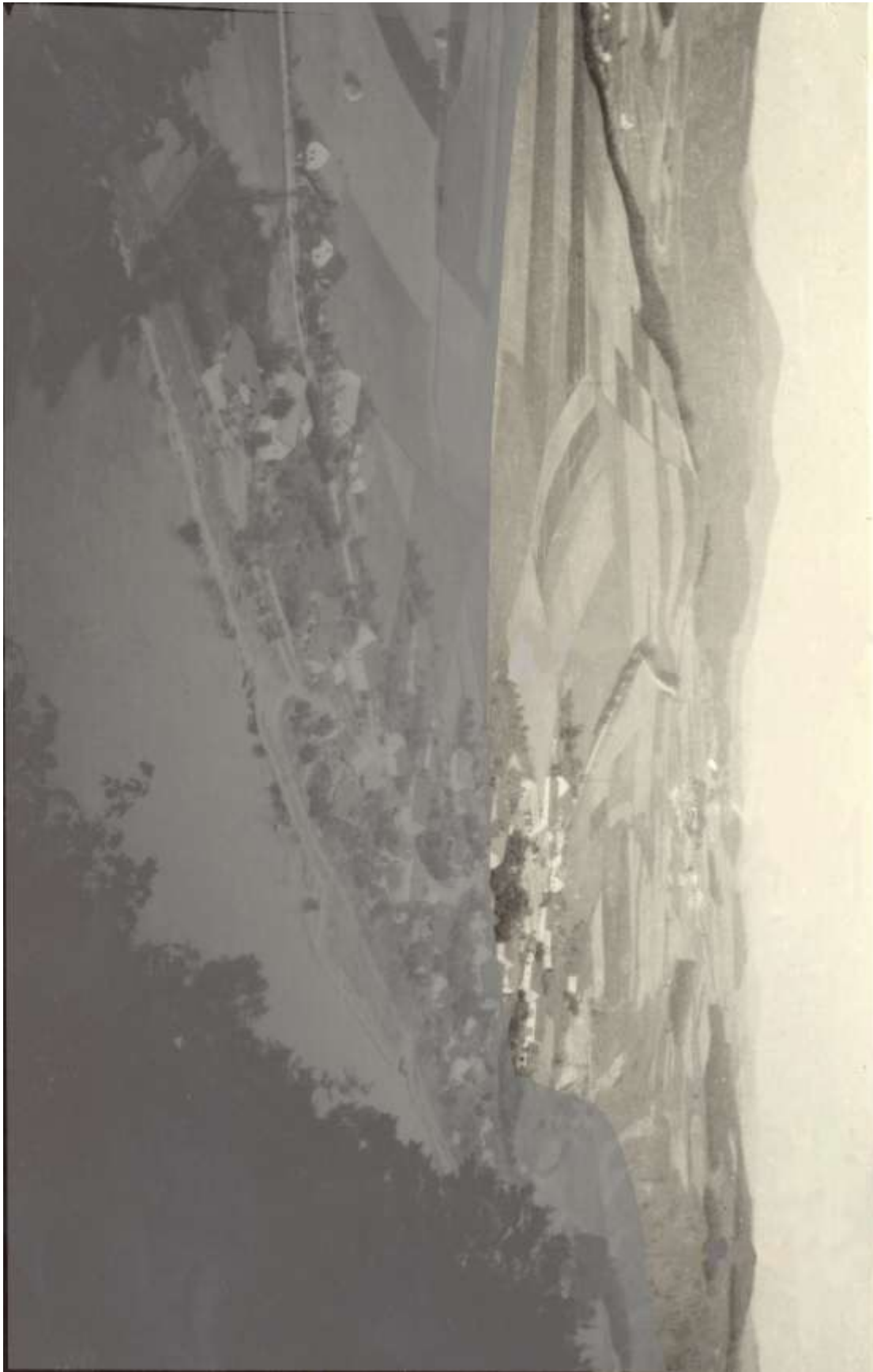
Staré Zvírotice, jak jsou dnes zatopeny