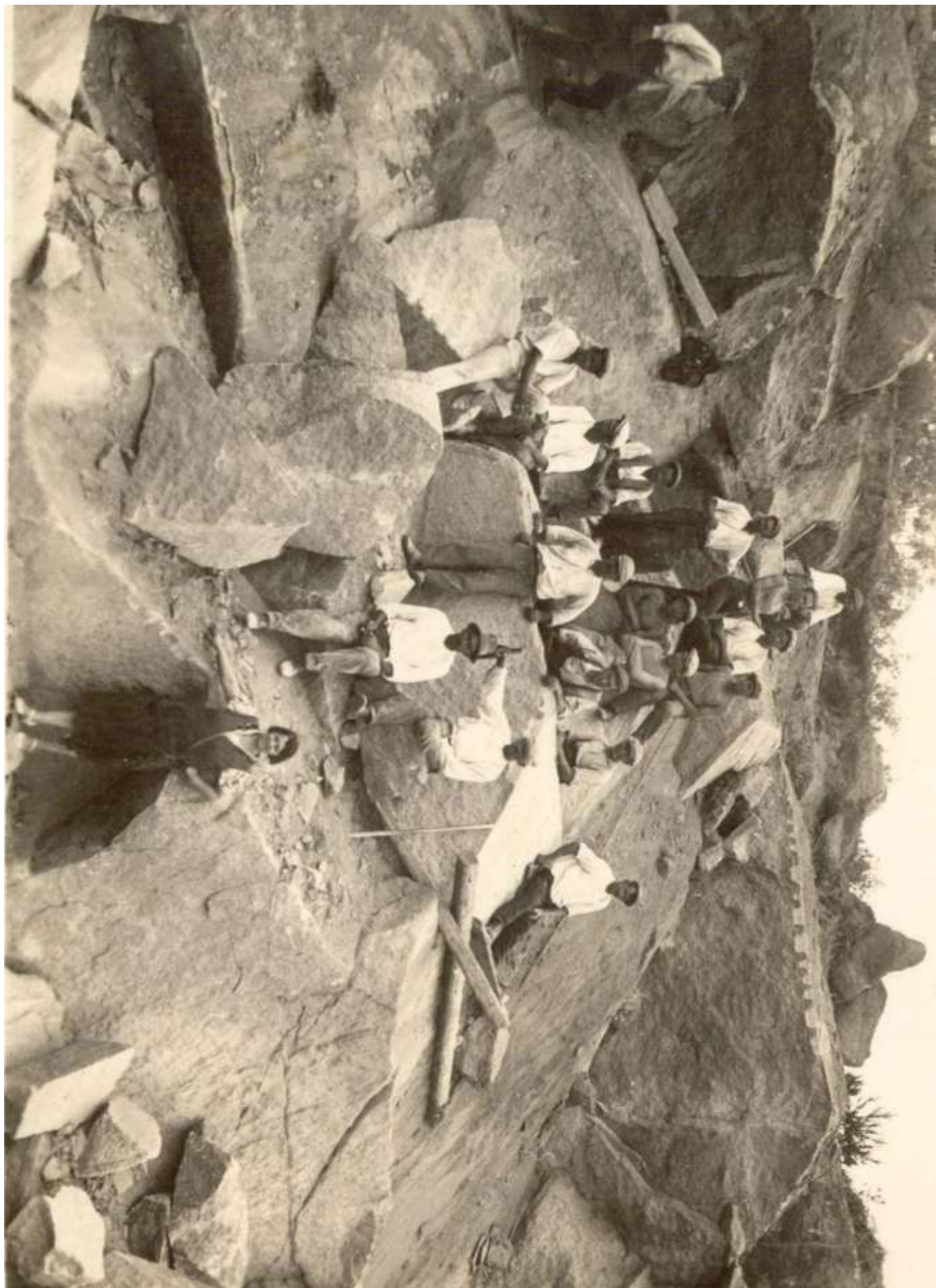
Spoločná foto kamanilů v kamanných doloch u Zúritia