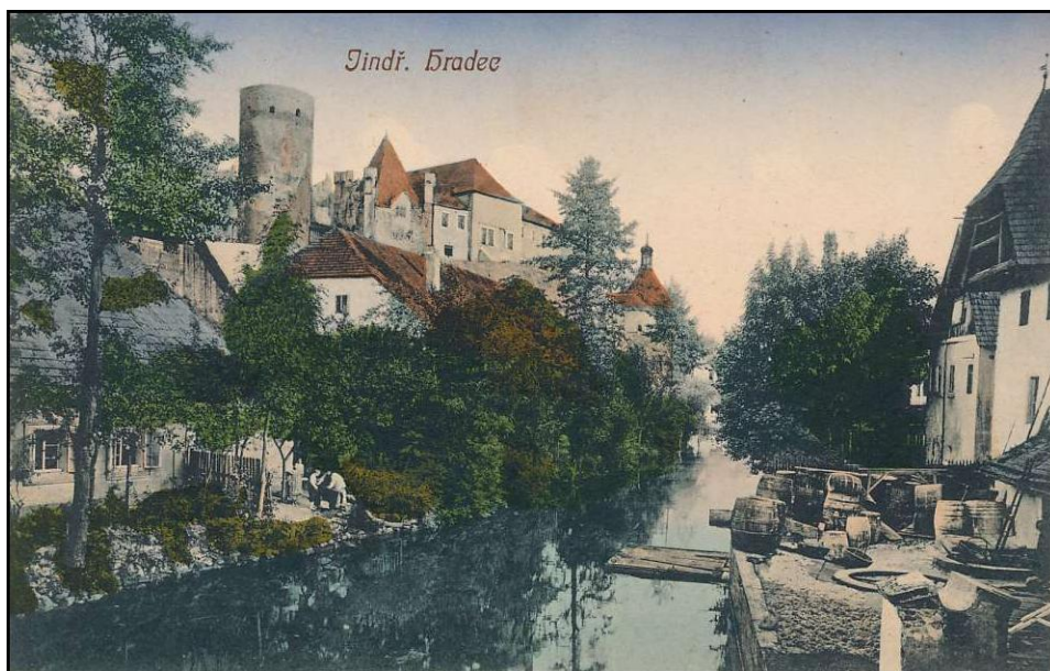
Obr. III.a, podzámčí v Jindřichově hradci, historická fotografie