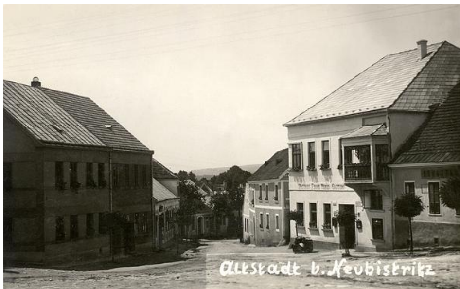
Obr. V.a, náměstí ve Starém městě pod Landštejnem, historická fotografie