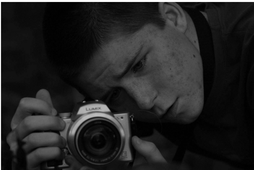
Obr.II, Jindřich Prošek nastavující čas, autor: Karel Vinš