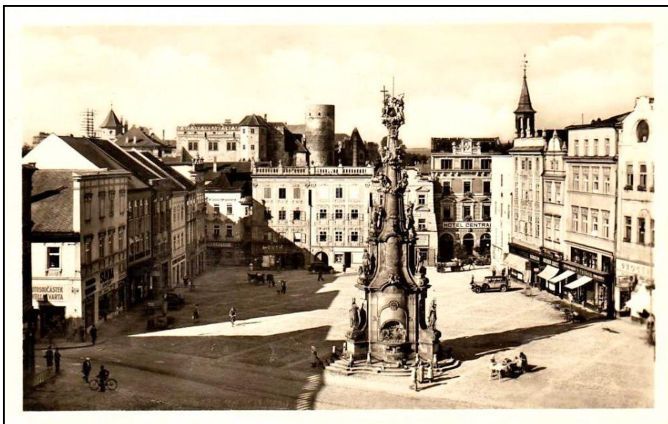
Obr. II.a, náměstí v Jindřichově hradci, historická fotografie