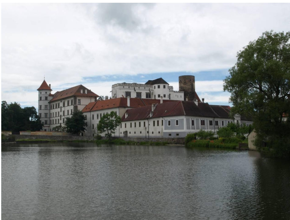
Obr. I.b, Zámek v Jindřichově hradci, současná fotografie, autor: Karel Kudláček