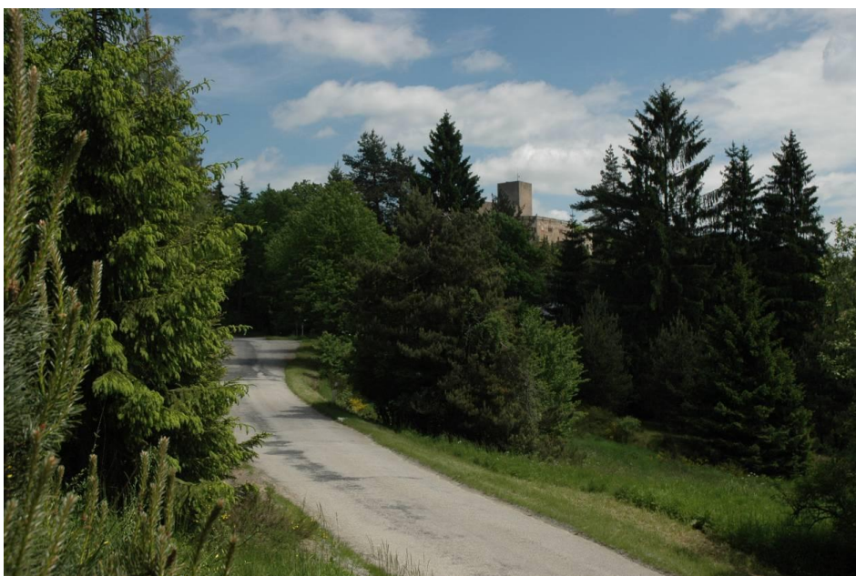
Obr. IV.b, příjezdová cesta k hradu Landštejn, kolem Marklu (Pomezí), dnešní fotografie, autor: Dominika Adamcová