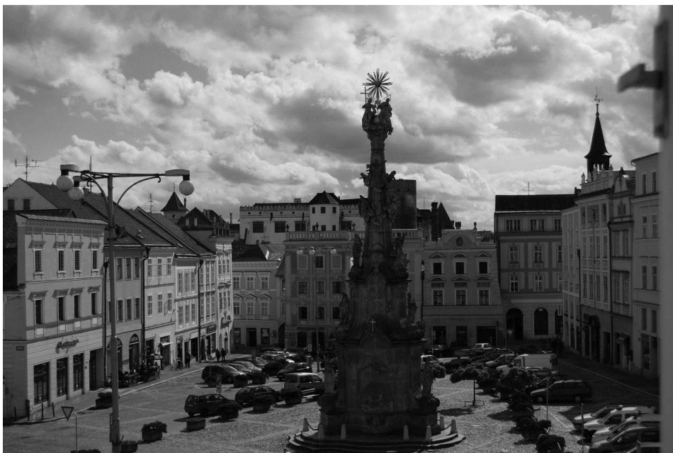
Obr. II.b, náměstí v Jindřichově hradci, dnešní fotografie, autor: Karel Vinš