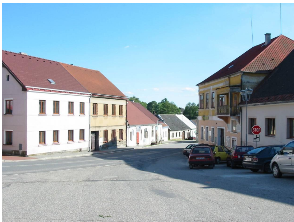
Obr. V.b, náměstí ve Starém městě pod Landštejnem, dnešní fotografie