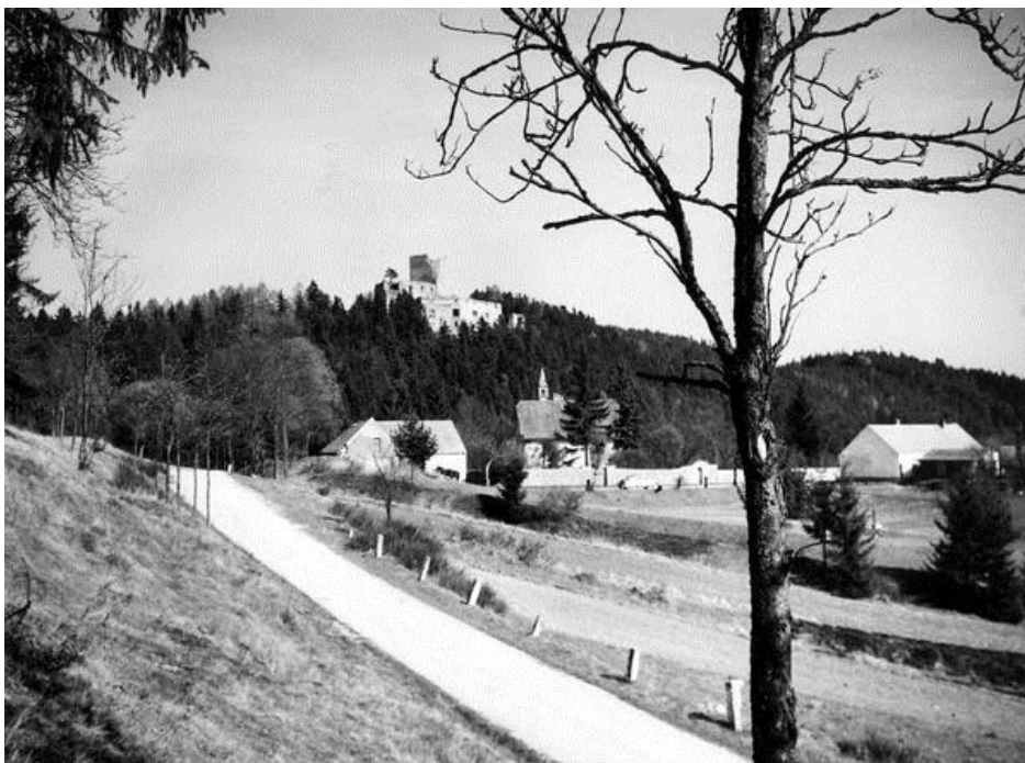
Obr. IV.a, příjezdová cesta k hradu Landštejn, kolem Marklu (Pomezí), historická fotografie