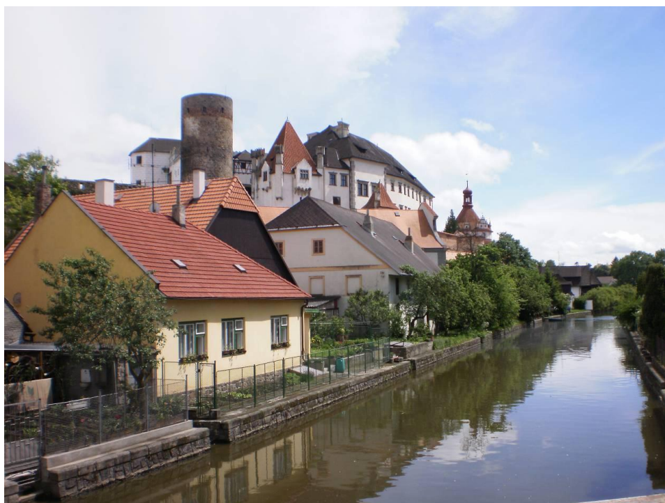
Obr. III.b, podzámčí v Jindřichově hradci, dnešní fotografie, autor: Jakub Melichar