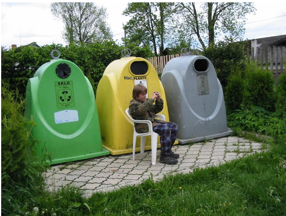
Obr. VII., Jakub melichar - odpadní zátiší, autor: Karel Kudláček