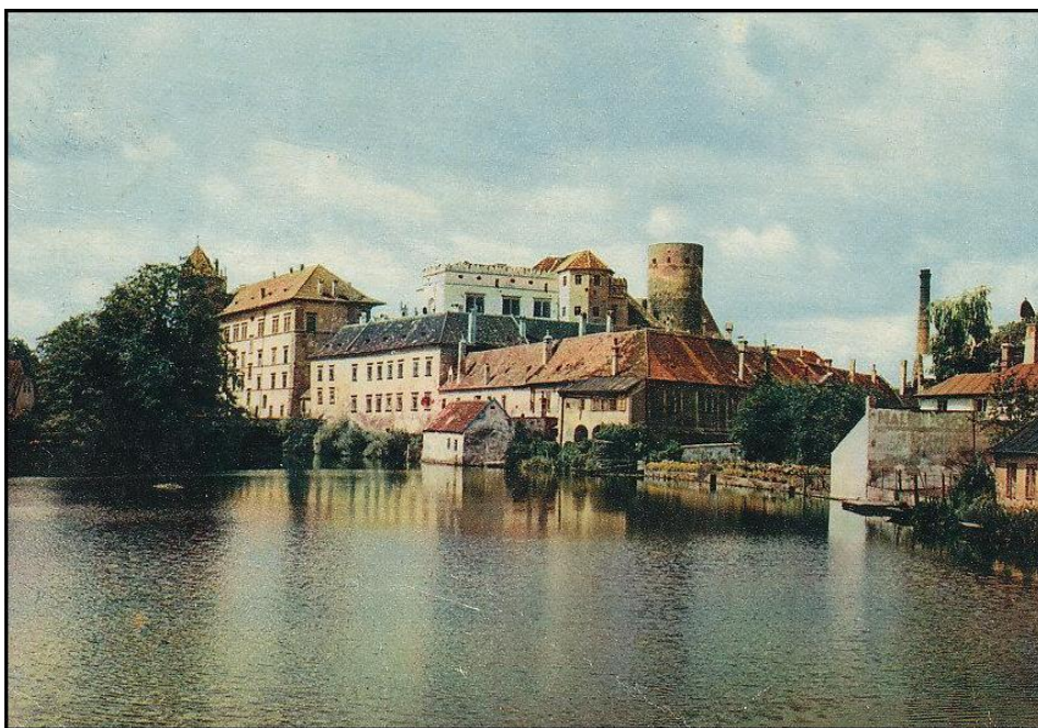
Obr. I.a, zámek v Jindřichově hradci, pohlednice