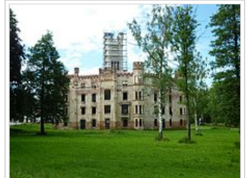
Oprava věže zámku

V roce 2008 byly vstupy zazděné a zamřížované, omítka opadaná, stěny rozpraskané a prorůstající náletovými dřevinami, okna vytlučená. [2] Nemá střechu ani okna, v některých místnostech jsou propadlé stropy. [5] Interiéry jsou v roce 2007 zcela zničeny. [3] V roce 2010 se v zámku začaly provádět drobné opravy (byla obnovena krytina ozdobného cimbuří, jsou provizorně zabeďněny okenní otvory). Objekt byl rovněž zpřístupněn veřejnosti (sezona 2011: od 1.7. do 31.8.; 9:00 - 11:00, 13:00 - 16:00). V současnosti (2012) dochází k opravě budovy správce a zájezdního hostince.