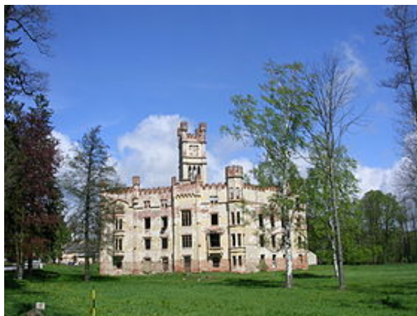
Zámek Český Rudolec